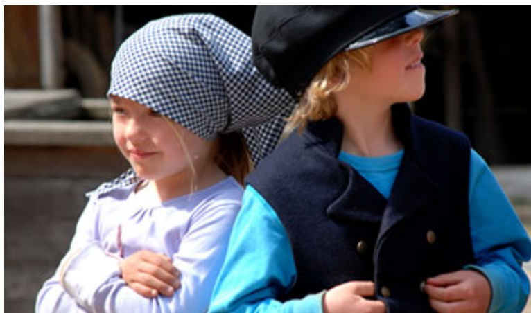
Leg i Onsjöstugan

Den anden gruppe var en gruppe yngre autistiske børn (6-7 år) der manglede talesprog. Her arbejdede vi med temaet "Børn i gamle dage" med hjælp af "klæudtøj" og spejler. Hvem er jeg nu og hvem er du, hvordan føler jeg etc. Videre legede vi med børnene i "Onsjöstugan" hvor man kan lege med kopiér af genstand som formidler livet i det gamle bondesamfund.