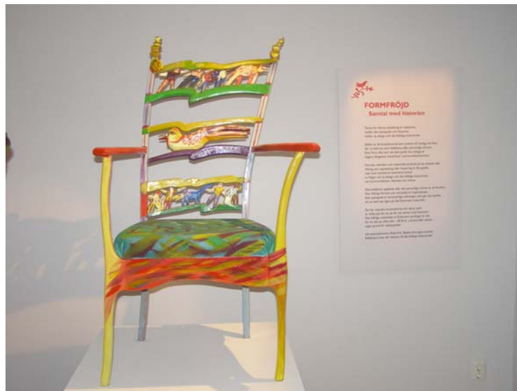
Folkkonst och Design

Forløbet rummede både arbejde med en udstilling om sydsvensk almuekunst i designperspektiv, at følge afdelingen for "barn och skola" med bl.a. aktiviteter for familien og undervisning af udviklingshæmmede, samt Kulturens arbejde med kommunikation i henhold til publikum.