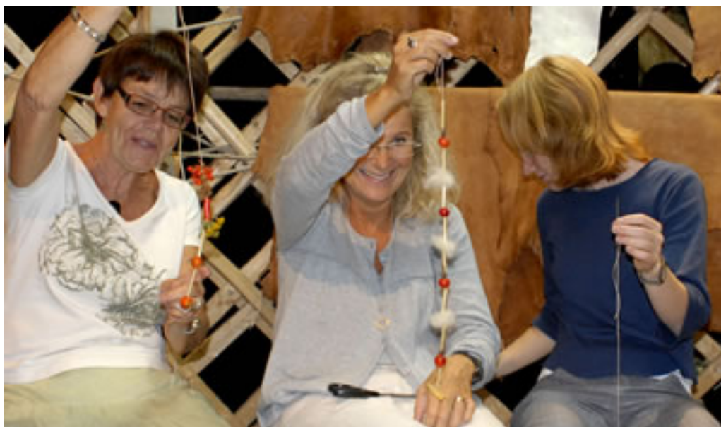
Lærere på kursus

Arbejdet med udstillingen er et pilotprojekt som vil bruges i det fortsatte arbejde med tilgængeligheden til Kulturen. Projektet indgår desuden i udviklingen af Kulturen som turistattraktion.