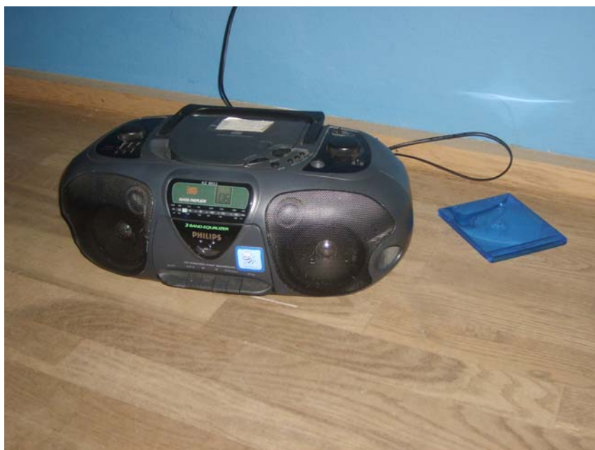
Lyd i udstillingen

Den sidste gruppe børn var en gruppe børn med den fysiske alder af 12 - 14 år, men med en hjerneaktivitet der modsvarer en 1-årigt børn. Alle børnene er kørestolsbrugere og mangler talesprog. Her stillede jeg mig lige fra start spørgsmålet om museet var den rigtige plads for disse børn. Er det ikke spil af ressourcer. Efter at have fulgt denne gruppe er jeg ikke i tvivl – disse børn har lige så stor ret som alle andre at "gå på museum". Jeg har i denne gruppe oplevet glæden ved at komme på museum, fascination for historien og forundringen over genstanden. Her arbejdede vi med sansepædagogik. Fortrinsvis musik og lys. Desuden fik eleverne røre og snuse til genstand og urter