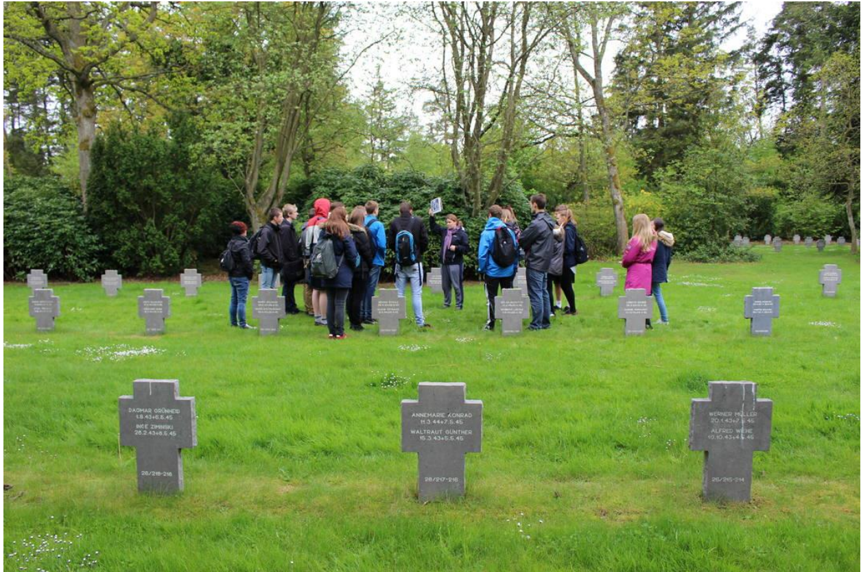
Camp 7 Oksbøl