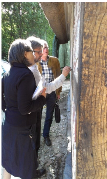
Kroen fra Skovsgaarde istandsættes 2013