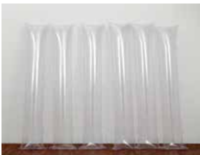
> William Louis Sørensen, Struktur . 6 elementer. Transparent serie, 1967, Sorø Kunstmuseum.

Fag: Alle fag. Fx dansk, historie, filosofi, samfundsfag, alle sprogfag, retorik.