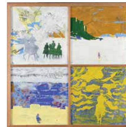
> Per Kirkeby, Den langløbede colt , 1966, Sorø Kunstmuseum.