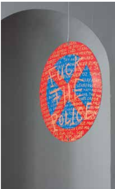
> Objekt: Brad Downey, Untitled , 2010, Museet for Samtidskunst