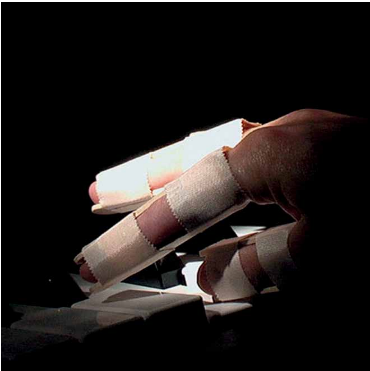
> Videostill: Su Mei Tse, Das Wohltemperierte Klavier , 2001