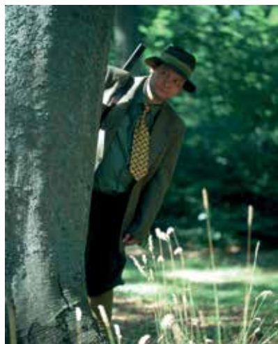
> Videostill: Peter Land, The Lake , 1999, Sorø Kunstmuseum

Matrix-grupper bruges til at strukturere gruppearbejde og sikre videndeling på tvær af grupperne. Eleverne inddeles fx i fire grupper á fire elever, og eleverne tildes et nummer fra 1 - 4. Efter et aftalt tidsrum går grupperne fra hinanden og alle 1'erne danner en gruppe, alle 2'erne danner en gruppe osv.