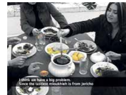
> Videostill: Larissa Sansour, Soup over Bethlehem , 2006, Museet for Samtidskunst