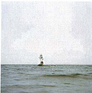
"Its My Island" 2007